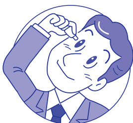
コンタクトレンズを装着 したまま点眼できます