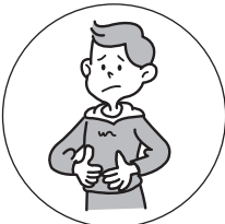
おなかの弱い方の 整腸に