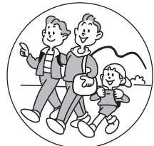
旅行など環境の変化で おなかの調子をくずしたときに