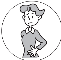
おなか はったときに